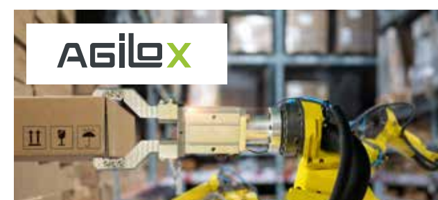
Agilox Fahrerlose Logistik-Roboter aus Österreich

Das Team des US-Unternehmens produziert gefeierte und teils prämierte Serien und Dokumentationen für Netflix, Disney+ und Co. Dazu zählt etwa die Serie Chefs Table , in der Sternköche weltweit porträtiert werden. Die Dokuserie ist eine der meist aufgerufenen auf Netflix.