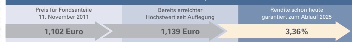
FPI Höchststandsgarantiefonds mit Ablaufdatum 2025. Stand: 11. November 2011

So sichern Sie sich schon heute Ihre Rendite zum Ablauf – ein Beispiel